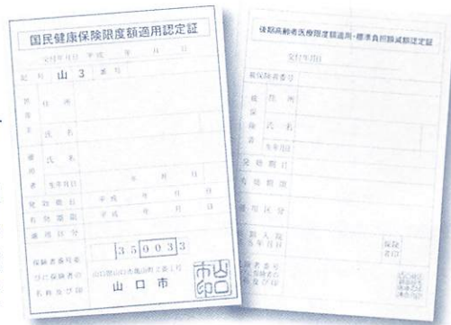
【国保】青色の証書 【後期】水色の証書

これまで入院のみに適用されていた、窓口での医療費の支払いが自己負担限度額（保険適用外の費用は対象外）で済む制度が、4月1日から外来でも適用されることになりました。適用を受けるには、認定証の発行が必要な場合がありますので、該当される方は、下記の要領で申請をしてください。