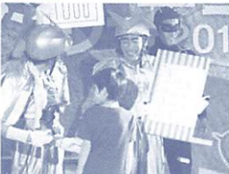
ヒントを出さず実験ジャー

え付けの申込用紙で徳地地域交流センター(〒747-0231 徳地堀1533 ☎0835-52-0217)