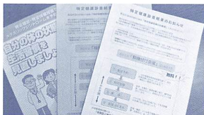
このような書類が届いていませんか

特定健康診査の結果から、生活習慣病発症の可能性が高いと判定された方には、特定保健指導の案内をしています。案内のあった方は、ご自身の生活習慣を見直し、健康によい生活習慣を始めてみませんか？