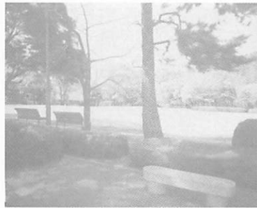
昨年度大賞受賞作品 「オブジェー風景(公園)」

市民のみ なさんから 応募のあつ た作品を審 査し、入賞 入選作品を 展示します。 多くのみ なさんの来 場をお待ち しています。(入場無料)