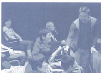
和やかに意見を交わします

映画好きな方、初心者の方、自分なりの感想を表現したい方など、誰でも気軽に参加できる映画鑑賞会です。「楽しかった!」だけでは終わらない、ちょっと大人の映画の楽しみ方講座にぜひ参加してみませんか。