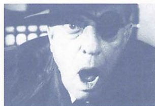
【FILM】監督:アラン・シュナイダー/脚本:サミュエル・ベケット/出演:バスター・キートン