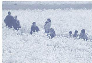
菜の花もちょうど見ごろです

今回の会場は、古くからは八十八ヶ所霊場の地として、近年は車えび養殖発祥の地として名高い秋穂地域です。早春の穏やかな瀬戸内海の自然とご当地グルメをぜひご堪能ください。