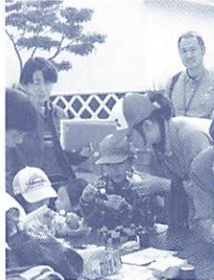
大人から子どもまで楽しめます