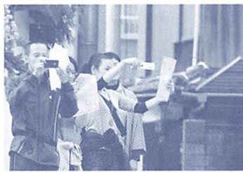
チェックポイントで「パシャリ」

ロゲイニングとは、エリア内の指定されたチェックポイントを制限時間内（3時間）にどれだけ多く回ることができるかを競うスポーツです。なかでも、チェックポイントを回った証としてデジタルカメラ（携帯電話可）で写真を撮る場合、フォトロゲイニングといえます。