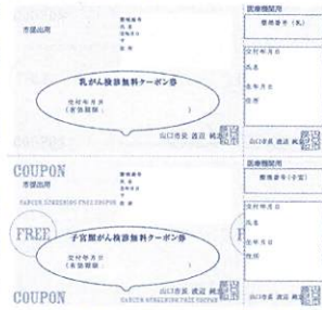
無料クーポン券(黄色) 対象の方にお届けしています

今年度、対象となる方に、子宮頸がん・乳がん検診の無料クーポン券を送付していますが、まだ1割程度の方しか利用されていません。がん検診は、がんの予防・早期発見のため重要です。この機会に、クーポン券を活用して受診してください。