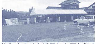
(例) 空き地を活用した回収拠点

市民の皆さんの利便性向上と資源回収量の拡大を目的に、資源物の回収拠点を設置し、管理運営を行う団体に対し、必要な費用を支払います。要件など、詳しくは、お問い合わせください。