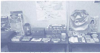
昨年度の展示の様子

1月17日(木)は、「防災とボランティアの日」で、15日(火)~21日(月)は「防災とボランティア週間」です。市では、期間中、防災に関連した展示を行います。ぜひご覧ください。