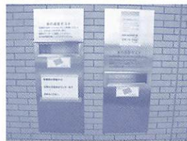
小郡図書館のブックポスト

■開館日 小郡図書館(小郡下郷 609・1 ☎0833・973・0098)、徳地図書館(徳地堀 1527・3 ☎0835・52・0043)