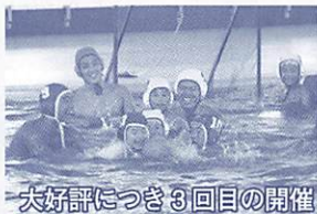
大好評につき3回目の開催