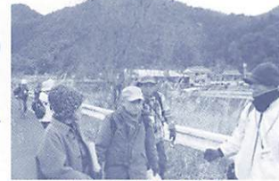
昨年の散策の様子

森の案内人と一緒に、自然観察をしながら散策を楽しみます。今回は徳地島地域の街・川・巨木を巡り、途中で福田貝館に立ち寄りま。