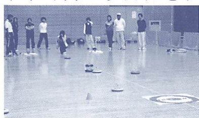
カローリングとそっくりな競技です

氷上のスポーツ「カローリング」を屋内フロア用に開発した「ユースポーツ「カローリング」の大会です。友だちや家族3人でチームをつくり、ポイントゾー