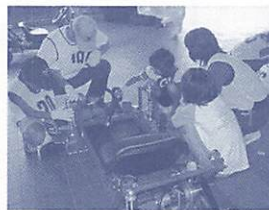
ゴーカートを組み立てる様子