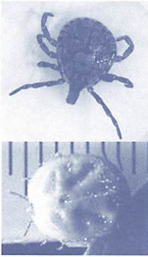
タカサゴキララマダニ(上) 吸血し約1cmまで肥大したマダニ(下)

春先から秋にかけてみられるツツガ虫病などのダニ媒介性疾患の予防のため、ダニに咬まれないようにご注意ください。