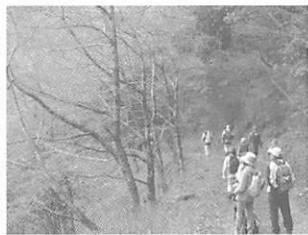
昨年度の自然観察の様子

「セラピーロード自然観察」 森の案内人とともに、植物等の自然観察をしながら、散策を楽しみます。今回は大原湖畔コースから四氏谷川沿いを歩きます。