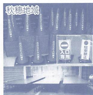
秋穂地域 カラークーン、サインパネル、折りたたみ式長机 など

今年度、市では秋穂と仁保の2地域が採択され、コミュニティ活動に直接必要な備品を購入しました。