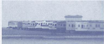
さまざまな鉄道模型