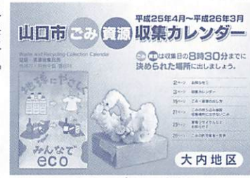
カレンダーの表紙

平成25年度版「ごみ・資源収集カレンダー」を、市報3月1日号と同時配布しています。カレンダーが届いていない場合は、次の場所ですぐ受け取ることができます。 ■カレンダーの配布場所 市資源循環推進課(大内御堀496)、市環境衛生課南部衛生担当(小郡総合支所)、各総合支所、各地域交流センター(小郡、秋穂、阿知須、徳地、阿東を除く) および分館、市大海総合センター(秋穂東1-130-5) ■市資源循環推進課 (☎ 0833-941-2185)