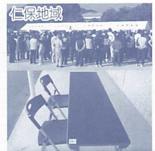
仁保地域 テント、長机、パイプイス など

今後も順次、各地域の備品を整備していく予定です。詳しい活動実績については、市ウェブサイト（表紙参照）をご覧ください。