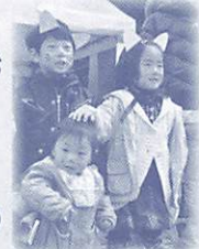
白狐メイクで まつりを楽しもう

指定旅館の内湯を開放します。入浴には白狐まつりへの協賛金(100円)が必要です。(両日とも10時30分から中原中也記念館前で入浴券を配布)