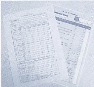
【左】 特定健康診査受診券 【右】 質問票(健診等機関控) …必要事項をご記入ください。