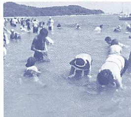
「暑い」夏に「熱い」思い出はいかがですか