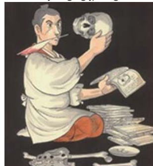
手塚良庵(手塚治虫「陽だまりの樹」から) ©手塚プロダクション

問い合わせ先／萩博物館 ☎0838-25-6447 ☎https://www.city.hagi.lg.jp/hagihaku/index.htm