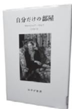
中央図書館に所蔵

『自分だけの部屋』は、当初、著者が女学生たちに対して行った講演を台本として書かれたもので、講演では「女が文章を書く」ことを励ましています。とてもすてきなリズムです。そして「女が」というところで「なんだ、男には関係ない本か」と思わず、男性にもぜひ読んでほしいと思います。周りにばかにされても自分の仕事を貫こうとする人を応援してくれる本です。