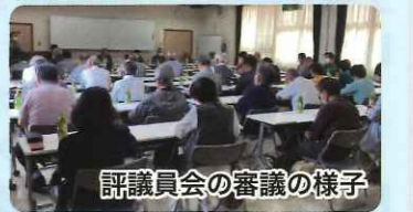
評議員会の審議の様子