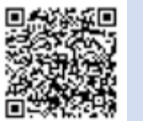
名簿 (市議会ウェブサイト)