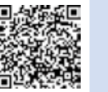
議会の構成 (市議会ウェブサイト)