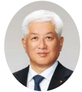
副議長 原 真也