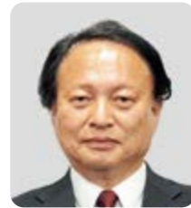
やまもと こうじ 山本 浩二