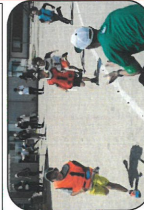
↑昨年度のキッズレストランの様子

5月31日(日)に湯田小学校グラウンドで、第61回湯田地区町内親睦大運動会が開催されました！晴天の中、子どもから大人まで、全員が全力で競技に臨みました。接戦の末、優勝に輝いたのは前町町内会でした！選手として参加された方はもちろん、応援や運営でご参加された方も本当にお疲れ様でした！