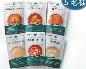
【提供事業者】 株式会社秋川牧園

秋川牧園で大切に育てた食材を使用した、レトルトタイプのカレーとスープ。素材のおいしさを大切に、副原料にこだわり、シンプルな原料で作りました。子どもから大人まで幅広い年代の方にお楽しみいただけます。