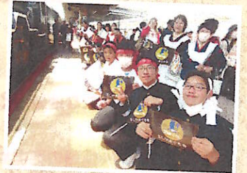
SLやまぐち号 おもてなし