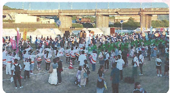
昨年のふしの踊り