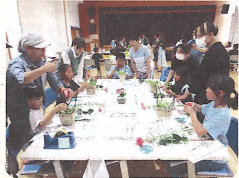
昨年度フラワーアレンジ