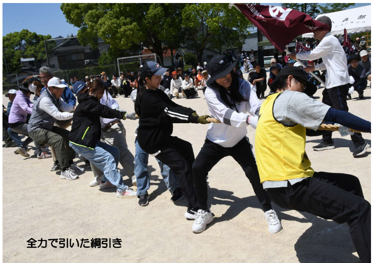
全力で引いた綱引き