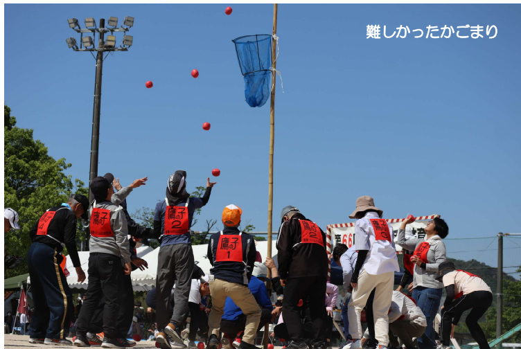
難しかったかごまり