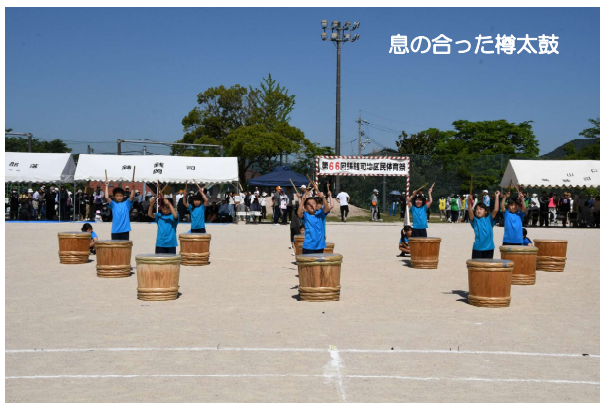
息の合った樽太鼓