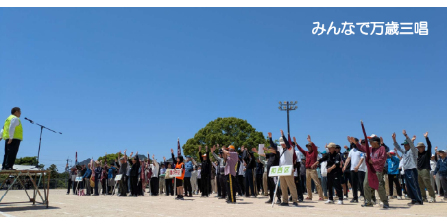
みんなで万歳三唱