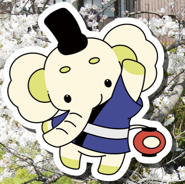
山口市健康づくり推進キャラクター けんぞう

「やまぐち健康ポイント」とは、 山口市が県や協力店と連携し、 市民のみなさんの健康づくりを 応援する制度だゾウ!