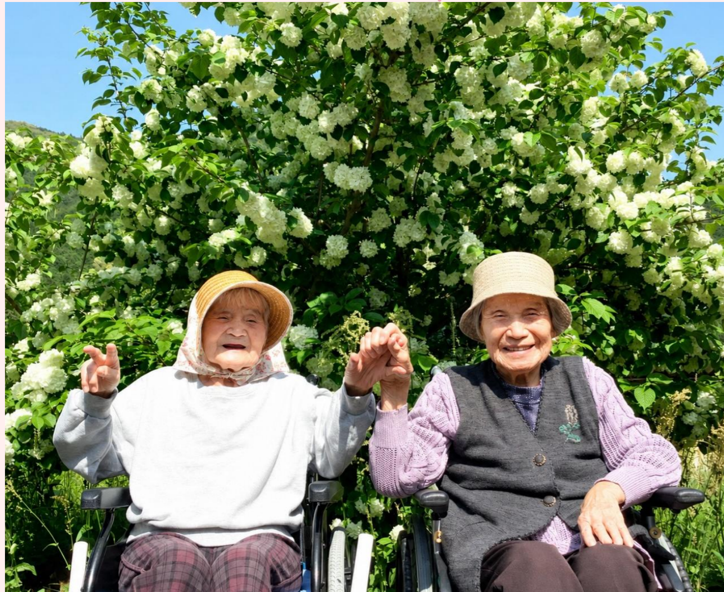
オオデマリの木の下で (特養とくぢ苑ユニット型)

令和8年6月 第85号 発行:社会福祉法人佐波福祉会 山口市徳地八坂1330番地 TEL(0835) 56-1306 FAX(0835) 56-1849