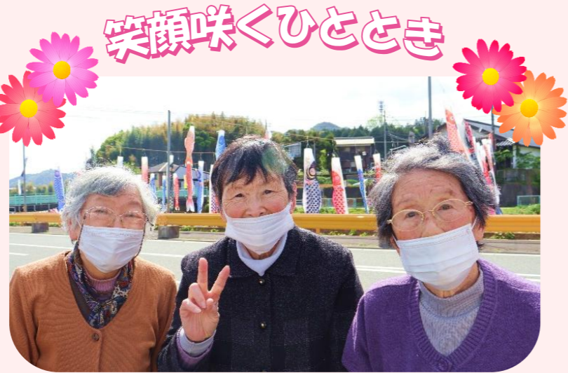
仁保の郷へこのぼりを見に来ました (とくぢ苑デイサービス)