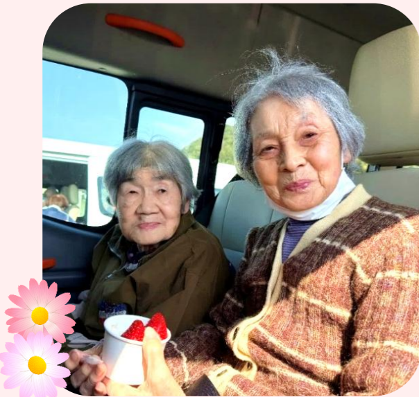
あさむらいちご園のいちごソフトに舌鼓♪ (特養とくぢ苑従来型)