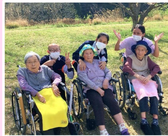
伏野河川公園へ出かけました (特養従来型)