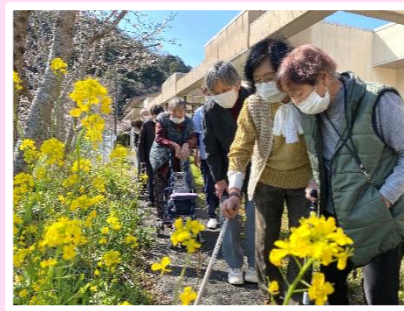
陽気に誘われ苑の近くを散策しました (とくぢ苑デイ)