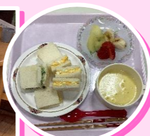
フルーツを盛り付けてピクニックランチが完成! (かじかの里)