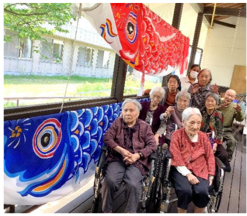
近いねえ～大きいねえ～ (かじか)