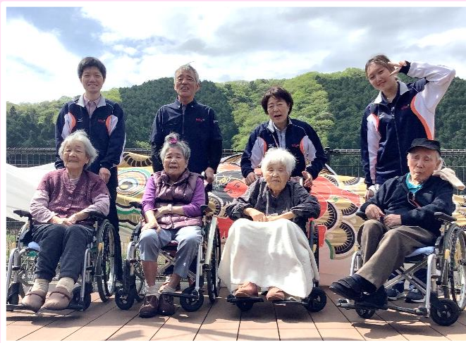
口八ス島地温泉へ出かけました (特養ユニット型)