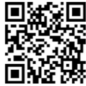
申し込み用メールフォーム

TEL : 083-928-0250 Email : miyano@city.yamaguchi.lg.jp