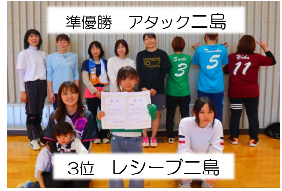
準優勝 アタック二島