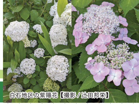
白石地区の紫陽花