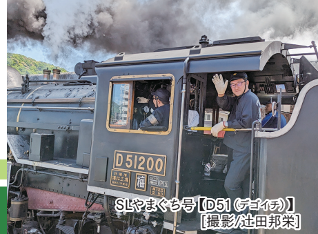
SLやまぐち号【D51(デボイ)】