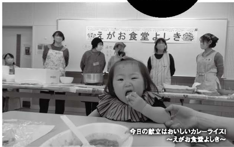
今日の献立はおいしいカレーライス ～えがお食堂よしき～