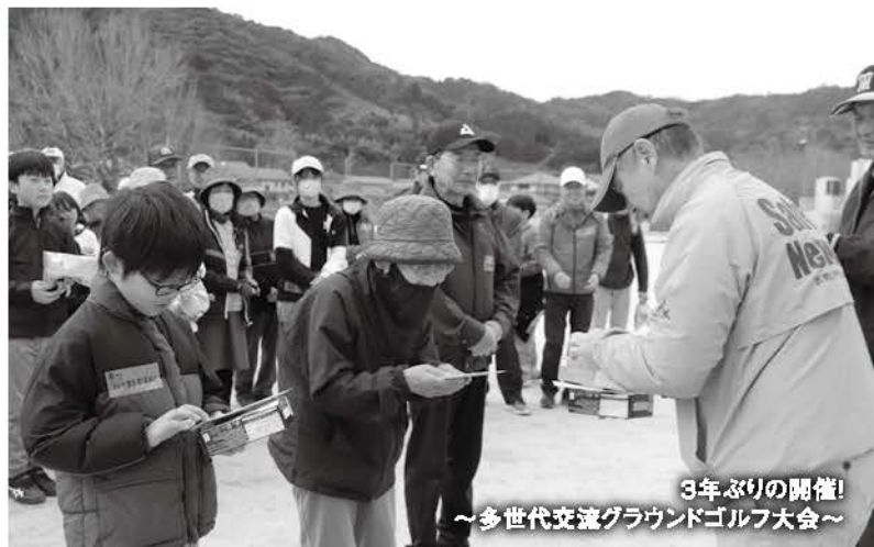
3年ぶりの開催! ～多世代交流グラウンドゴルフ大会～