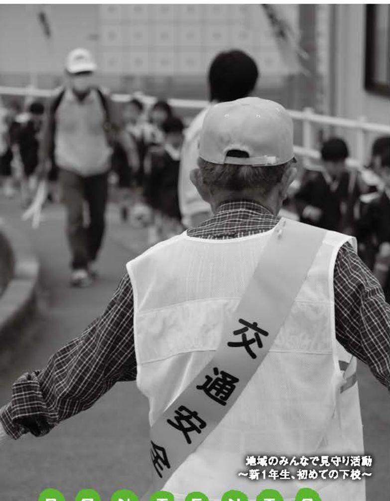
地域の人々で見守り活動 ～新1年生、初めての下校～