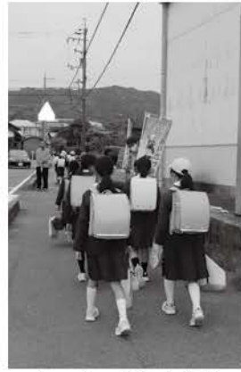
あいさつの日の様子

吉敷地域では、日頃から交通安全・防犯対策協議会やボランティアの方々が、立哨などに取り組まれるとともに、地域教育ネット「あいさつの日」の取り組みなどを通じて、登校時の見守りが行われています。