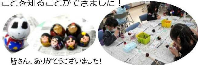
皆さん、ありがとうございました！

3月15日（日）に大内地域交流センターにて、大内・小鯖地域合同で山口市伝統工芸品である「大内人形」絵付け体験をしました。中村民芸社の職人さんのご指導で、自由に顔や模様を描き、マイ大内人形を完成させました♪体験前には“大内塗クイズ”を行い、楽しみながら大内塗のことを知ることができました！