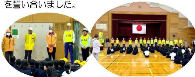
通学路の方向別に分かれて対面！自己紹介をした後、気を付けること等についてお話ししました。

見守り隊からは約20名が出席し、小鯖っ子の安全を見守ることや、元気よくあいさつすることを誓い合いました。