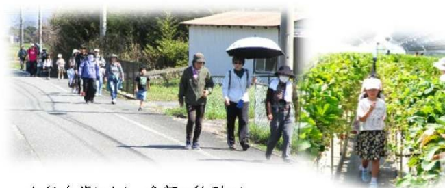
たくさん歩いた！ 全部で約6km！

4月11日（土）に参加者52名で小鯖地域交流センターを出発。“イチゴ屋けんちゃん”でいちご狩りをした後、小鯖八幡宮で男の料理サークル「腹ペコ」の方々が作られた美味しい「ぼたん鍋」をお腹いっぱいいただきました♪