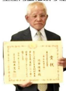
おめでとうございます♪

その努力が評されて、令和7年度の「飼料用米多収の日本一」の単位収量の部で、農林水産大臣賞を受賞されました。これからもお体に気をつけて、頑張ってください。