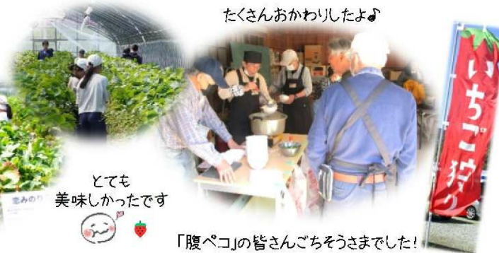
たくさんおかわりしたよ♪