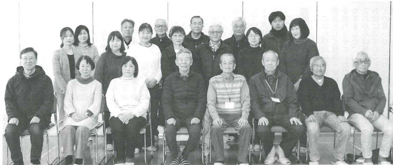
山口市阿知須地区民生委員児童委員協議会名簿 (任期:令和7年12月1日から令和10年11月30日まで)

発行●阿知須地区民生委員児童委員協議会/山口市民生委員児童委員協議会 ●山口市上野小路89-1 電話(083)928-3012