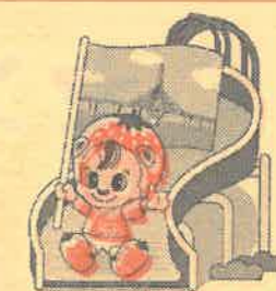
佐山ご当地レノ丸

佐山地区の人口（推計）2,485人（男：1,188人、女：1,297人）世帯数 1,024戸（2026.4.1現在）