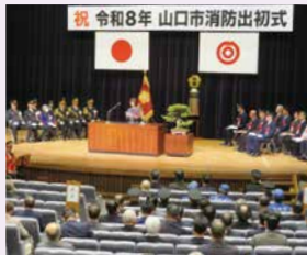
令和8年山口市消防出初式(1月11日)