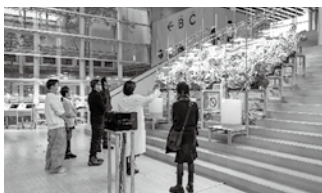
PROJECT MRT—Natureless Solution / 太陽と土と糞から切り離れたテクノロジーの再考

問 YCAMが、どのような取組を通じて本市のまちづくりにおける役割を果たしていくのか伺う。 答 市民が日常的に参加できる取組を進めることで、市民に親しまれ、誇れる施設となるよう努めるとともに、新たな価値と交流を生む文化芸術創造拠点として、引き続き発展させていく。メディアテクノロジが持つ可能性とYCAMが有する創造性を様々な分野で発揮し、地域の多様な主体と共に行う創造的な活動を通じ、文化の薫る創造都市づくりに貢献していく。 ●その他の質問 ○中山間地域における農業の担い手確保