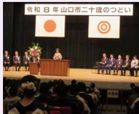
令和8年山口市二十歳のつどい(1月11日)