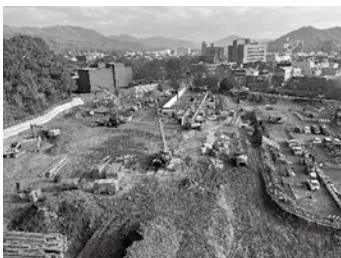
市民交流棟や広場、立体駐車場の整備に向けて解体が進む旧庁舎

問 今後の公共施設の適正配置について、どのような考え方で取り組むのか伺う。 答 人口減少局面にあっても発展する都市づくり、安心して暮らし続けられる地域づくりを進める上で、今後もある一定の公共施設への投資は必要であり、中長期的な視点での施設の更新・維持管理費用等の縮減を図ることが重要と考える。公共施設の適正配置は、機能の集約化や複合化等で機能をできる限り維持しつつ、施設の縮減を基本としている。 ●その他の質問 ○産業政策について ○地籍調査事業について ○空き家対策について ○農業政策について