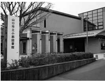
山口市立小郡図書館

問 市は、日本一本を読むまちづくりを掲げ、第四次山口市立図書館サービス計画を進めているが、令和8年度当初予算資料にはこの文言がなく、その看板を取り下げたのか。また、資料購入費の大幅削減や学校への図書配送廃止等によって、図書館サービスの低下が懸念されるが、サービス低下を招かないための代替案があるのか伺う。 答 日本一本を読むまちづくりの方向性に変更はない。重複購入の抑制等による真に必要な資料整備に努め、市立中央図書館の本を学校最寄りの図書館で受け取れるようにするなど、利便性低下を招かないよう取り組む。