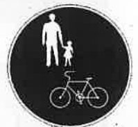
「普通自転車歩道通行可」の道路標識