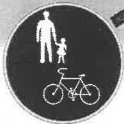
「普通自転車歩道通行可」の道路標識