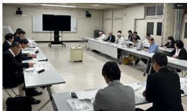
↑過去の移動市長室の様子

任意の様式に町内会名と年代を記入し、大殿地域交流センター2階おおどのコミュニティ協議会事務局に持参またはセンター入り口の右手にあるポストに投函してください。