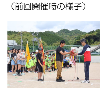
（前回開催時の様子）

今年も運動会の季節がやってきました！晴天に恵まれることを願いながら開催準備を進めています！