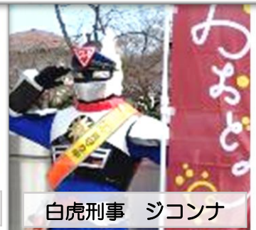
白虎刑事 シコンナ