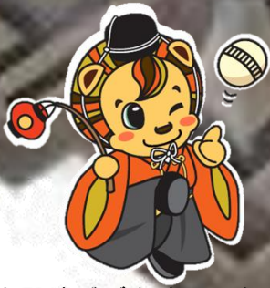
大殿地域ご当地レノ丸