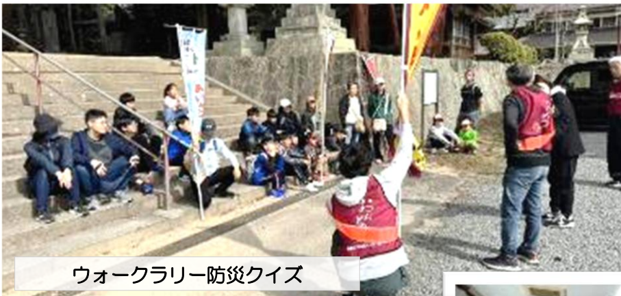
ウォークラリー防災クイズ