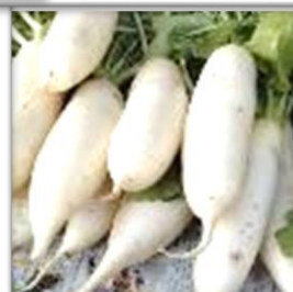
小学生栽培の大根