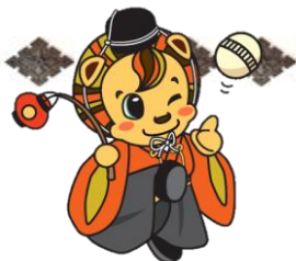
大殿地域ご当地レノ丸