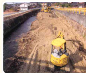
河川浚渫(しゅんせつ)実施箇所(県管理干見折川 免地地区)

数箇所の法定外公共物の整備や河川の浚渫(しゅんせつ)など、関係者の要望により工事を実施しています。