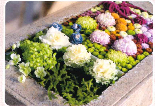
令和4年元旦(嘉川八幡宮での最初の花手水)

やわらかな光に包まれ、嘉川で40回目の新年を迎えました。嘉川八幡宮の手水に花を飾らせていただくようになり、地域の皆さんの温かな見守りのお陰で5年目を迎えました。感謝の気持ちでいっぱいです。