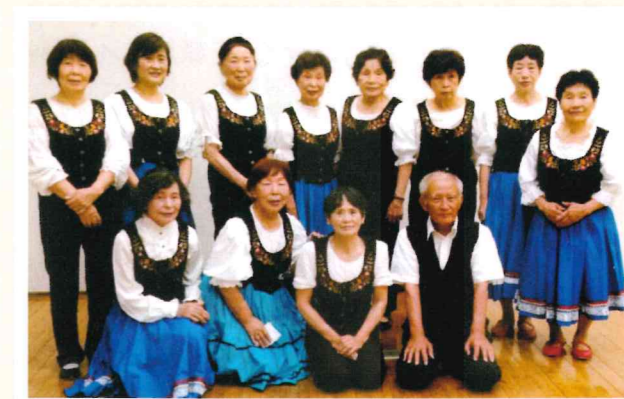
前列右から2番目が筆者