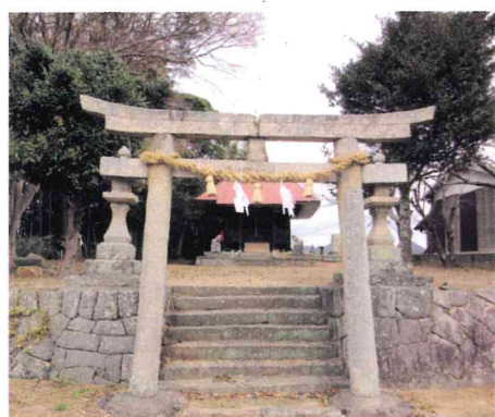
原条区住民の共同作業で清掃を終えた八千戈神社 通称 黄幡(オウバン)さま

また、原条地区の二つの自治会はそれぞれに組織運営や活動を独自に行っていますが、地区内にある公会堂、墓地、林地などの共有施設等の維持管理、八千戈(ヤチホコ)神社の祭事や共通する事業等の活動支援などについて、連携・協力を密にしながら住み良い原条地区を目指して取り組んでいます。