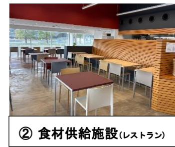
② 食材供給施設(レストラン)