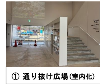
① 通り抜け広場(室内化)