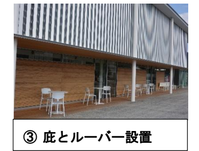
③ 庇とルーバー設置