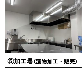
⑤ 加工場(漬物加工・販売)