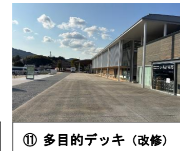
⑪ 多目的デッキ(改修)