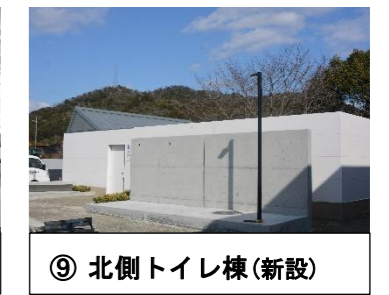
⑨ 北側トイレ棟(新設)