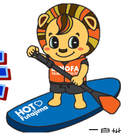
二島地域 ご当地レノ丸