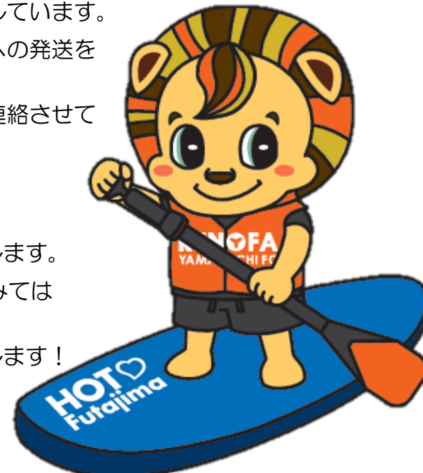
市ウェブサイトでは「広報ふたじま」のカラーバージョンがご覧いただけます。 ぜひチェックしてください。