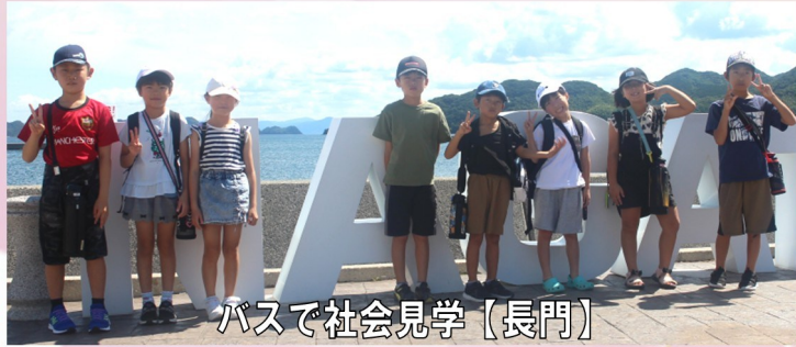
バスで社会見学【長門】