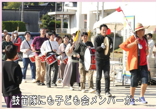
鼓笛隊にも子ども会メンバーが...