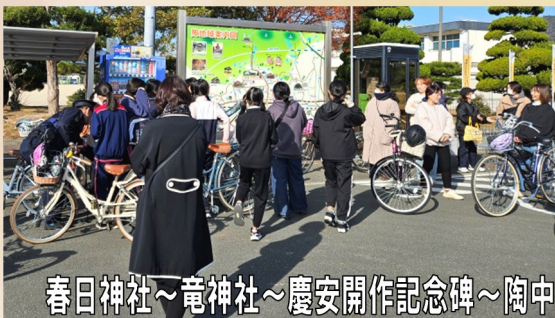
春日神社～竜神社～慶安開作記念碑～陶中央公園～日吉神社～陶の石風呂～八雲神社