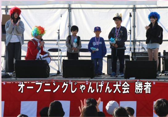
オープニングじゃんけん大会 勝者