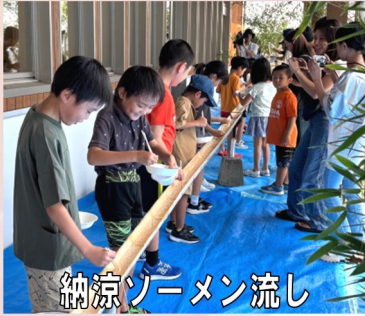
納涼ゾーメン流し