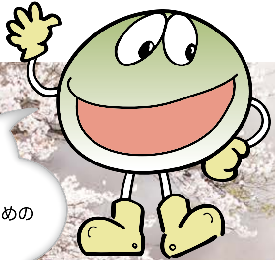
にっこりアースくん

はじめまして！ ぼくの名前はにっこりアース。よろしくね。 この本はわたしたちが健康なくらしを送るための 知恵と工夫がたくさんつまった本です。 さあ、ぼくといっしょに楽しく学習しましょう。