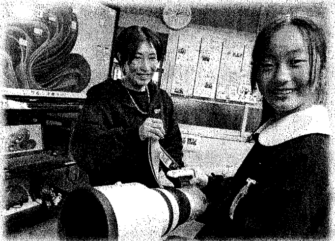
プロカメラマンの先輩が母校に! ○百万円のカメラに大興奮♪