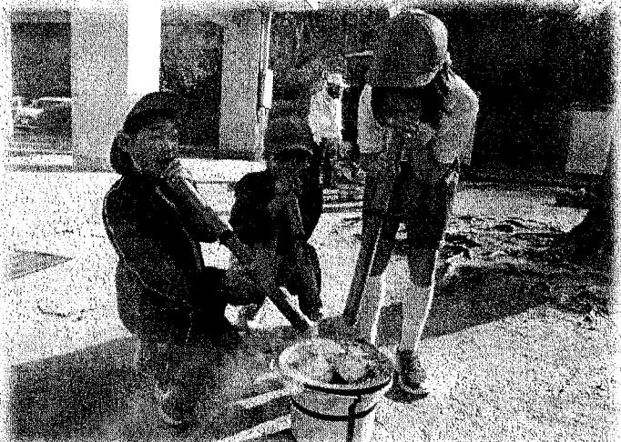
七輪体験学習で火起こし中! おいしいお餅をいただきました♪