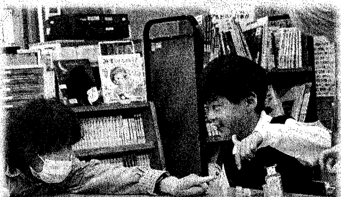
昔の遊び体験で「おはじき遊び」にチャレンジ! いっぱい遊んでいただいていたって嬉しいね♪