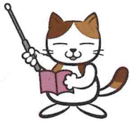
やまぐち路傍塾マスコットキャラクター ろぼにゃー