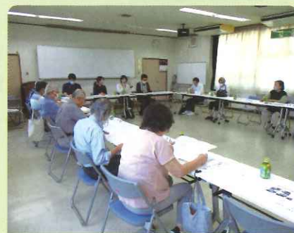
大内地区内のサロン交流会の様子です。課題について熟議しました。

「気軽に」「無理なく」「楽しく」「自由に」楽しんでみませんか。大内地区社協も支援しています！