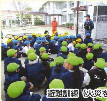
避難訓練（火災を想定）をしました

令和8年度の入級手続きを行っています。受入予定者数は、うえき学級・みなみ学級それぞれ、150人の合計300人を予定しています。また、きらきら学級（臨時学級）は、60人を受け入れる予定です。地域の方々にはたいへんお世話になっています。今後ご支援をお願いします。