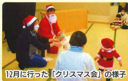
12月に行った「クリスマス会」の様子

令和7年度は、「こんなときどうする？」（乳幼児安全法）やミニ夏祭り、豆まき等の活動を行いました。子育てをされている保護者の方に大変喜ばれました。健やかに成長した子ども達。嬉しくなります！