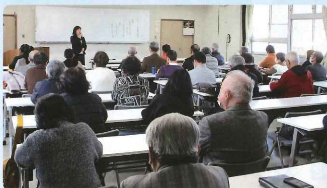
講演会には50名の参加がありました。

ご講演では、「相手との接し方 心構え」と題し、社会福祉士や保育士、防犯関係の代表者としてのご経験を活かしたユーモアのあるお話でした。聴講者一人ひとりの心に響く内容でした。特に心に残ったことは、「穴を掘るには、幅がいる」と言うことです。何かを成し遂げるためには、いろいろなこと(人の気持ち等)を考えた言動が必要であることを再認識しました。