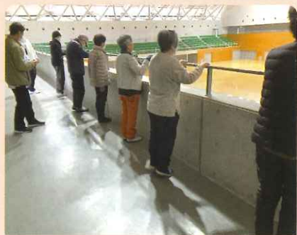
ウォーキングの基礎を学びました。 (リフレッシュパーク)

大内地区社協では、北東地域包括支援センターとタイアップして取り組んでいます。現在、令和8年度計画中です！