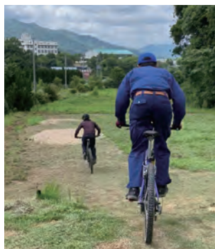
▲マウンテンバイク用のコースで走る様子

仁保むらづくり塾では、山道をマウンテンバイク用のコースに整備することで、人の往来を増やし、獣が近づきにくい環境づくりを行い、放置竹林や有害鳥獣被害を減らす、ユニークな取り組みを行っています。