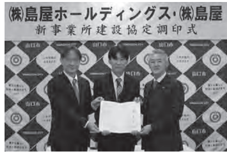
▲記念撮影の様子（左から市長、山口県産業労働部藤村企業立地統括監、吉貴代表取締役）

操業開始は、令和9年10月を予定しており、新たに10人の地元雇用を見込んでおられます。