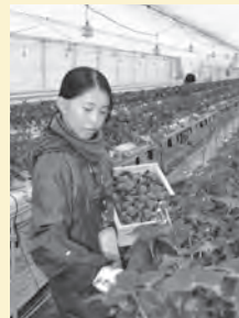
▲大切に育てられたイチゴが、一つ一つ丁寧に収穫されています。

また、毎年5月と11月に開催される「ふれあい体験デー」は、イチゴやまのいもの収穫と植え付け等を通じて、都市部と農山村の交流を促進し、食と農業のつながりを体感できる場となっています。 市内でつくられた農産物を地元で消費する地産地消の魅力は、新鮮で安全な食材を手に入れられることに加えて、農地や景観が守られることにあります。また、消費者の「おいしい」は、地域内の生産と消費の好循環を生み、次世代の農業の担い手を育てることにつながります。 山口市の恵みを、ぜひ日々の食卓に取り入れてみませんか。