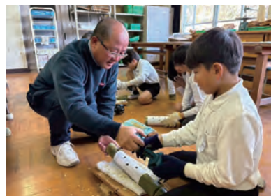
▲小学校での竹灯籠づくりの様子