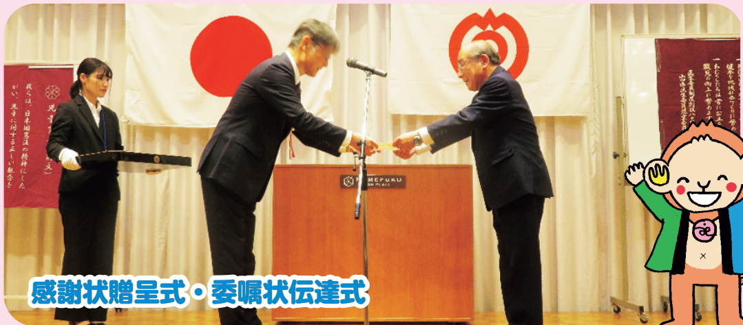
感謝状贈呈式・委嘱状伝達式