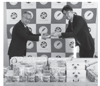
ダイナム山口阿知須店 様