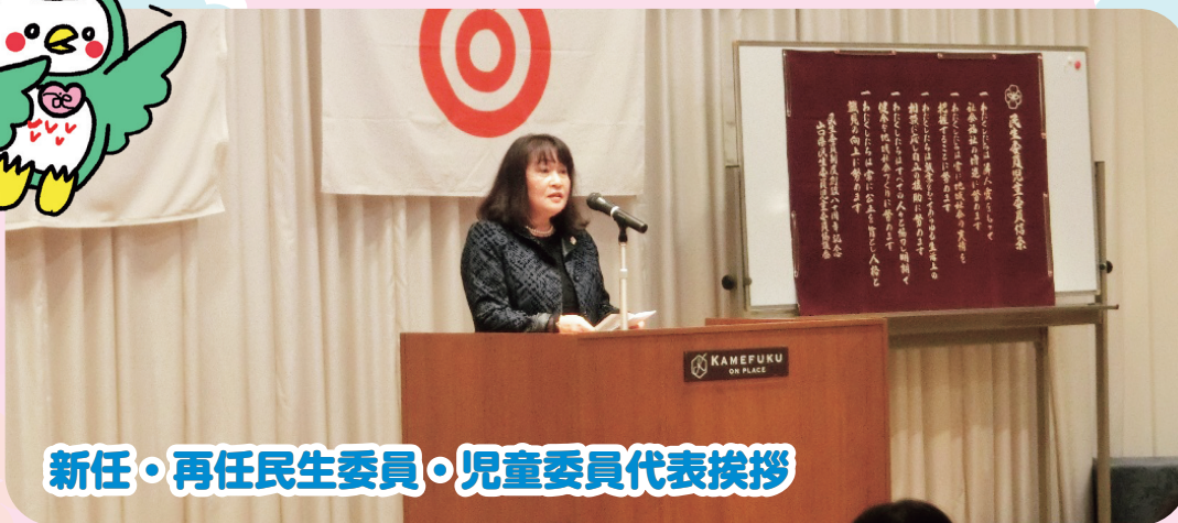
新任・再任民生委員・児童委員代表挨拶