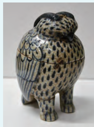
木菟 (ミミズク) 形香炉

萬代家コレクションの中か ら、季節を感じさせる書画 や茶器・食器等をよりすづ つて紹介します。