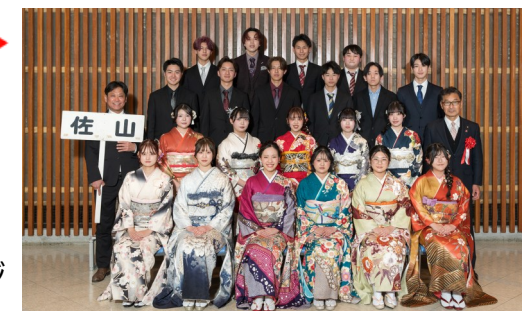
令和8年 山口市二十歳のつどい 佐山地区 2026年1月11日

■問合せ 佐山地域交流センター 地域担当 TEL・FAX 083-989-3525