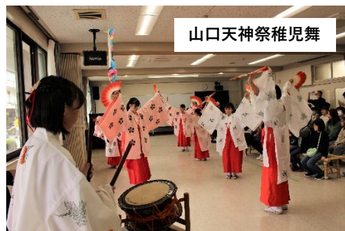
山口天神祭稚児舞