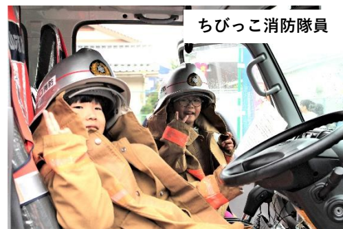
ちびっこ消防隊員