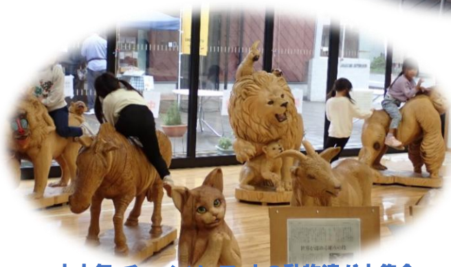
大人気 チェーンソーアートの動物達が大集合