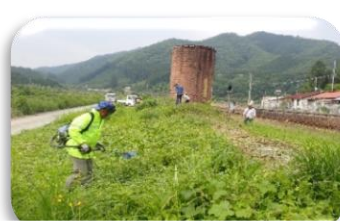
6月 サクラ植栽地の草刈り作業