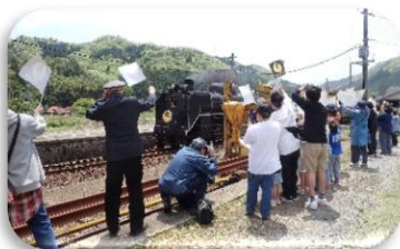
5月 R7年度 SL 運行開始を歓迎