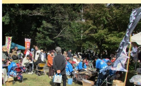
鮎の塩焼コーナー