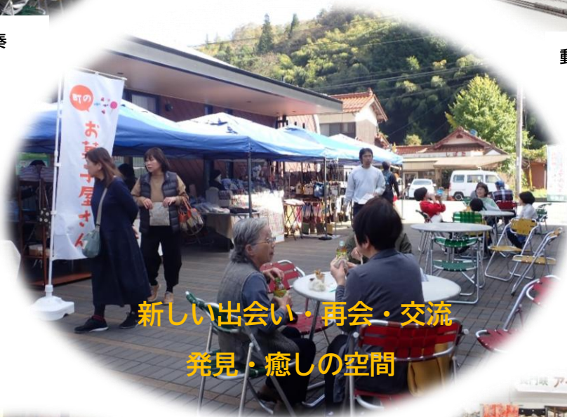
新しい出会い・再会・交流 発見・癒しの空間