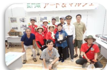
8月 SL 応援団や鉄道ファンと交流