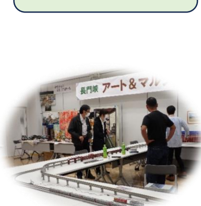
動く鉄道模型の展示