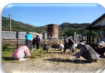
10月 さくら小学校児童と清掃活動