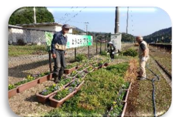
10月 花のプランター設置