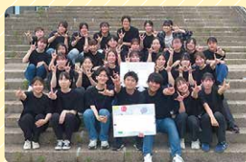
山口県立大学手話サークル☆幸せの星