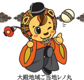
大殿地域ご当地レノ丸