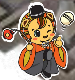
大殿地域ご当地レノ丸