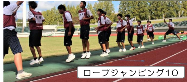
ロープジャンピング10