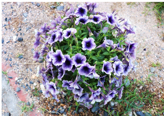
②⑤ ペールモース シルバ ペチエニア 〜一株でこんなに大きく育ちました