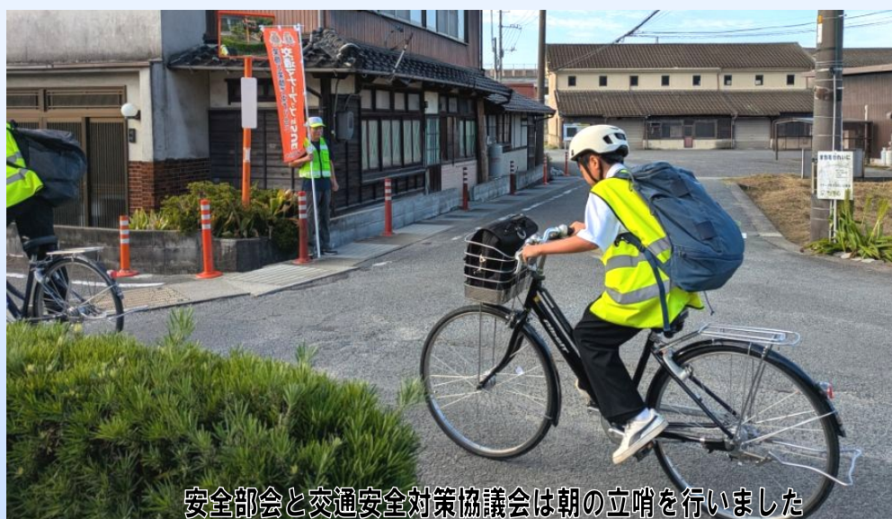
安全部会と交通安全対策協議会は朝の立哨を行いました