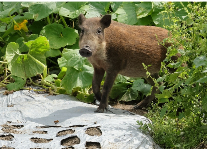
⑨ お前 芋泥棒じゃろうが