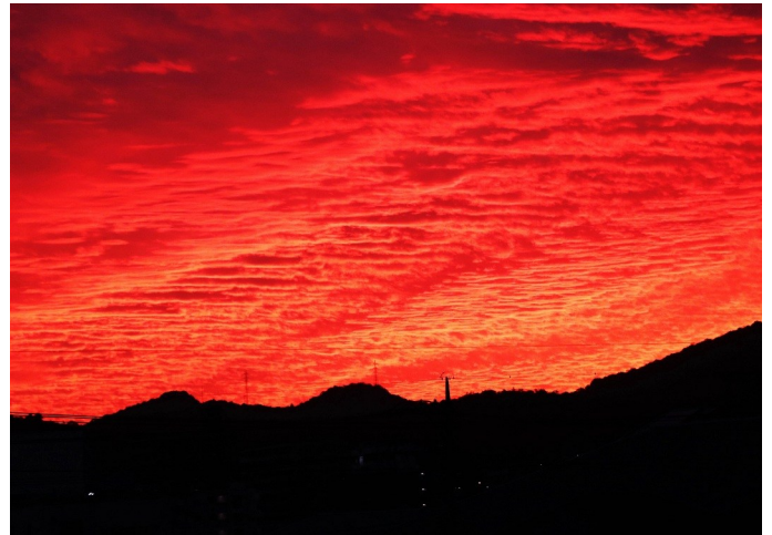
⑧ 秋の夕暮れ真紅に燃ゆる