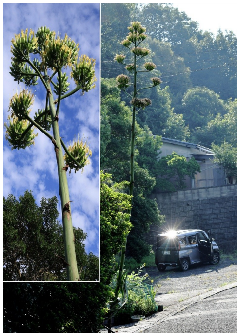
②① 数十年に一度咲くリュウゼツラン ②② 田園