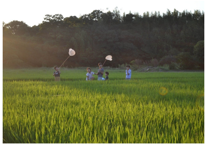
⑥ 夕空に赤トンボ舞う