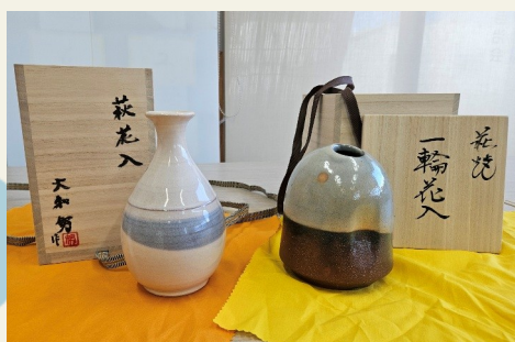
表彰状と共に 萩焼の花瓶が贈呈された

この日は、21地域の自治会、地域づくり協議会等の功労者表彰や、前市長や医療関係者等の特別表彰が行われました。陶連合自治会も功労者として栄誉を賜り、今後も市と地域の発展のために尽力することを誓いました。