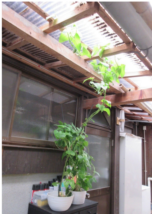
⑬ どこまで行くんー