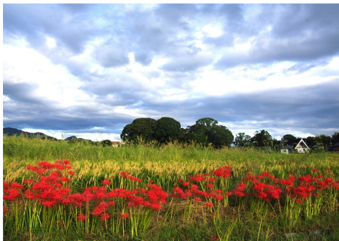
②⑥ 鎮守の森に秋の訪れ