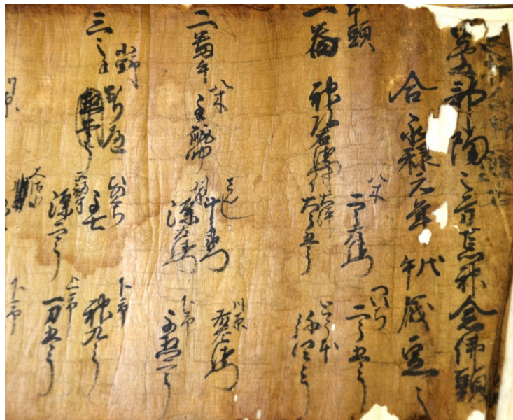
名寄帳の記載開始年が分かる端書部分

このほか、八雲神社に所蔵されている古文書で元亀元(1570)年記載開始の巻物「山王宮百手順文之事」(1巻、長さ約20㍍)にも触れ、当初は日吉神社の春祭りである百手神事の当屋の記録だったと考えられるとし、明治16(1883)年から腰輪踊の輪番へ統合されている点などを紹介されました。また、惣郷当屋名寄帳は「帳」ではなく「巻物」であり、八雲神社祭礼の当屋担当者名を途絶えることなく伝える記録なので『八雲神社祭礼当屋記録』といった呼称の方が妥当ではないかと呼びかけられました。