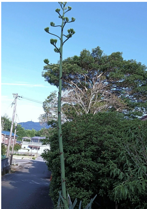
⑭ こんなにのびーる