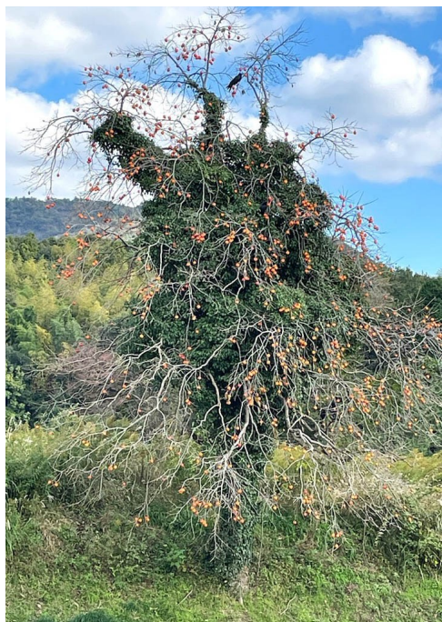
⑯ エクスペクト・パトロナム