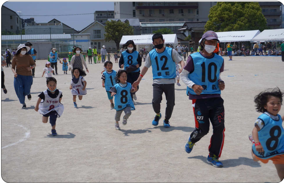
※写真は一昨年開催の様子

湯田地区は、開成、中野、止、去、よ、は、中、開、12、よ、湯田地区の町内親睦大運動会が今年も開催されます。今年も、湯田地区の町内親睦大運動会が、5月12日(日)8時30分から開催されます。今年も、湯田地区の町内親睦大運動会が、5月12日(日)8時30分から開催されます。