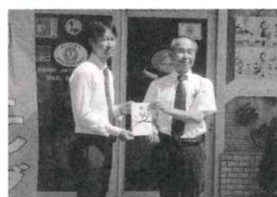
令和5年9月29日 (有)ムラカミクリーニング様