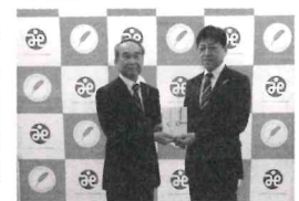
令和5年11月1日 (株)三宅商事様