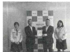
株式会社ヤクルト山陽様