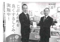
令和5年10月25日 メガネのふくだ様