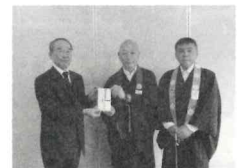
浄土真宗本願寺派山口教区防府組様