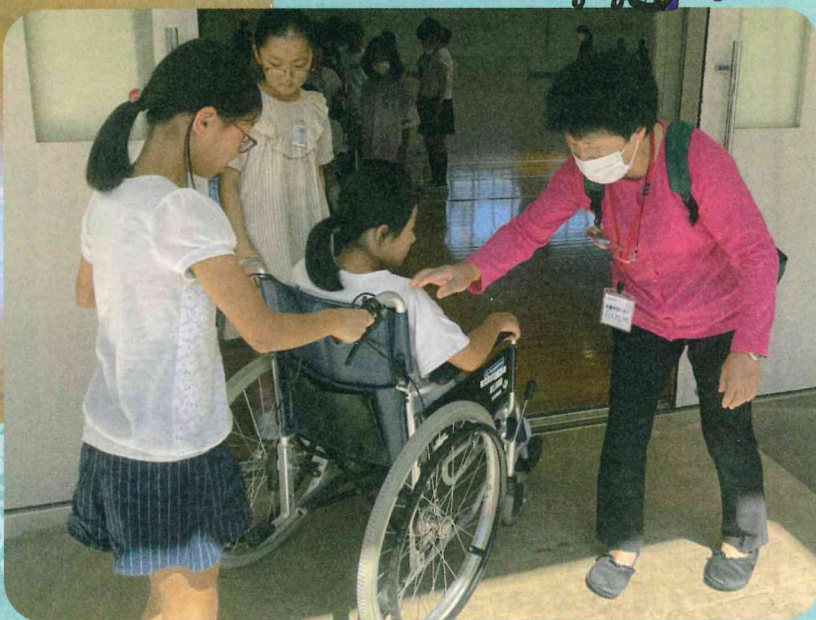
大股サポーターさんにお手伝いいただきました。