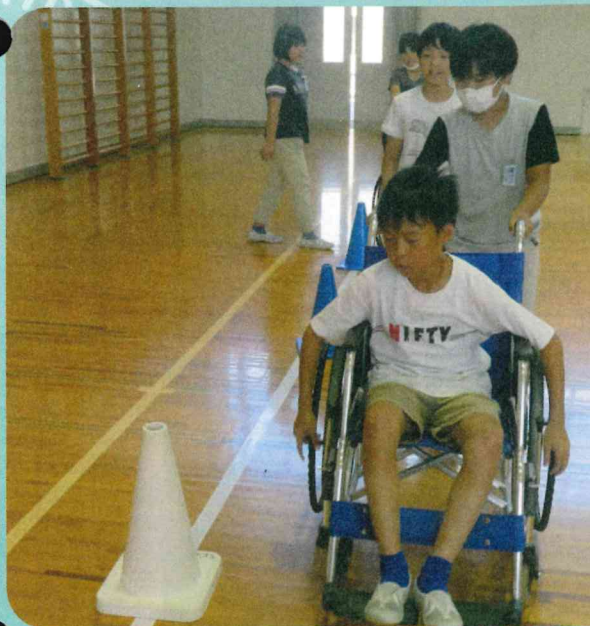
車いす体験の様子