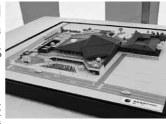
▲湯田温泉パークの完成図(建築模型)は、湯田地域交流センターでご覧いただけます。

10月17日(火)、湯田温泉パーク新築工事の起工式および安全祈願祭が、建設予定地(湯田地域交流センター南側)で、工事施工者主催のもと開催されました。 市では、「住んでよし・訪れてよしの湯田温泉」の発展の方向性のもと、本市が誇る地域資源である湯田温泉の恵みを市民の皆さんにもっと身近に感じてもらいたい。また、新たな交流と賑わいの拠点として湯田温泉パークの整備を進めています。 今後、建設工事を進め、令和6年度中に建設工事を完了し、令和7年度に供用開始、駐車場整備工事を予定しています。