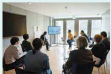
「サンカトーク」の様子

YCAMでは開館以来、メディア・テクノロジーを応用した作品を国内外のアーティストらと共に制作/発表してきました。ただし、作品の価値は、アーティストの知名度や、技術の新規性で決まっていくものではありません。作品を鑑賞し、それについて考える「鑑賞者」が作品の意味や価値を積み上げていく側面があるのです。そのため、YCAMでは作品制作にとどまらず、作品をより深く味わってもらえるような鑑賞の機会を提供するプログラムも数多く開発/実施してきました。公演における「バックステージツアー」や、展覧会や映画上映に際して実施する「サンカトーク」です。これらのプログラムは、日常的には接する機会の少ない作品の制作プロセスを紹介するとともに、参加者同士の意見交換を軸に多面的な作品理解を促すものとなっています。