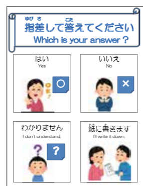
▲絵や文字を指さして使うコミュニケーション支援ボード

市では、今後、障がいの有無に関わらず参加できる地域での講座やスポーツイベントなどを通して、地域における障がいへの理解の促進や交流の活性化を図っていきます。