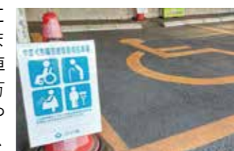
▲やまぐち障害者等専用駐車場

A 公共施設や店舗に設置された「やまぐち障害者等専用駐車場」は、障がいのある方や高齢の方などで歩行や車の乗降が困難な方が、利用証を提示することで、駐車することができます。必要な方がいつでも利用できるよう、駐車スペースを空けておきましょう。