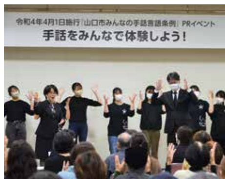
▲「山口市みんなの手話言語条例」PRイベントの「みんなで手話体験」の様子（令和4年11月）

また、合理的配慮（障がいのある人から配慮を求める意思表示があった場合に、負担になりすぎない範囲で、日常生活や社会生活を送る上で