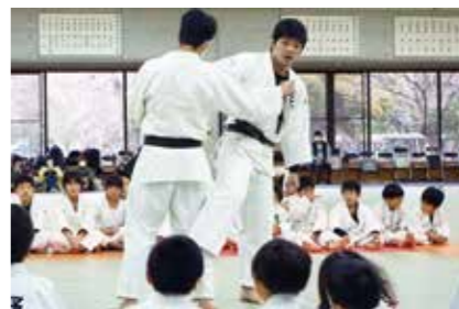
【写真1】大野将平 次世代育成プロジェクト 山口市ジュニア柔道教室

■マイナポータルからオンラインで転出届の提出や転入（転居）手続きの予約を開始（6日） ■経済対策第14弾発表（10日）