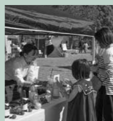
県内外から集結した70以上のブースが並び、出店者との対話を楽しみながら買物をする人々の姿が見られました。