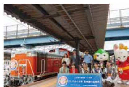
【写真4】DLやまぐち号夏季運行出発式

■山口市版子育て支援アプリ「やまぐちこぼり母子モ」にオンライン妊娠届、妊娠8か月アンケート配信などの機能を追加（1日） ■世界水泳選手権2023 福岡大会水泳スペイン代表チームのトレーニングキャンプを実施（2～21日） ■山口線全線開通100周年DLやまぐち号夏季運行出発式（15日）【写真4】 ■山口市防災ガイドブック（津波・高潮編）を更新（15日） ■増改築工事が完了した湯田地域交流センターの供用開始（1日） ■角一化成株式会社の事業所設備増設協定調印式（3日） ■全面改修中の国宝瑠璃光寺五重塔に覆屋外壁デザインシートを設置（18日）