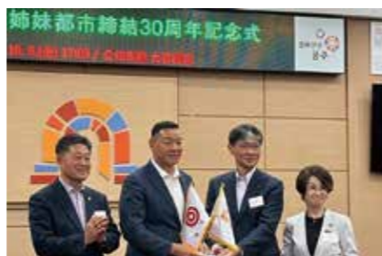
【写真6】姉妹都市締結30周年記念式

■山口市犯罪被害者等支援条例を制定（4日） ■山口市・公州市姉妹都市締結30周年記念訪問団を派遣（6～8日）【写真6】 ■第1回やまぐち伝統芸能フェスティバル開催（15日） ■湯田温泉パーク新築工事起工式（17日）